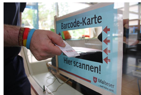
Mit ihrer personalisierten Karte mussten sich die Besucher ein- und auschecken.

gewährleisten zu können, haben wir personalisierte Gästerausweise verteilt. Mit diesen Ausweisen mussten sich die Gäste jedes Mal ein- bzw. auschecken.